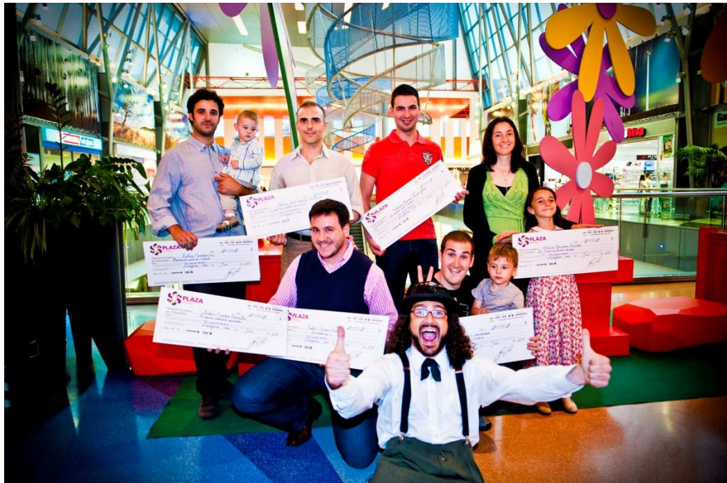
Concurso de Fotografía “El Cierzo”