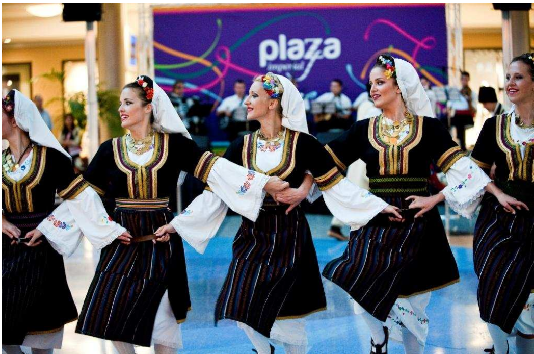
Festival Internacional de Folk