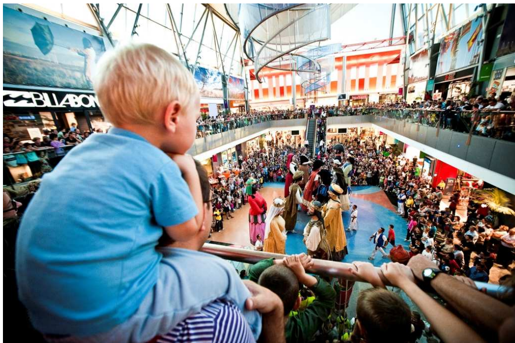
Comparsa de Gigantes y Cabezudos