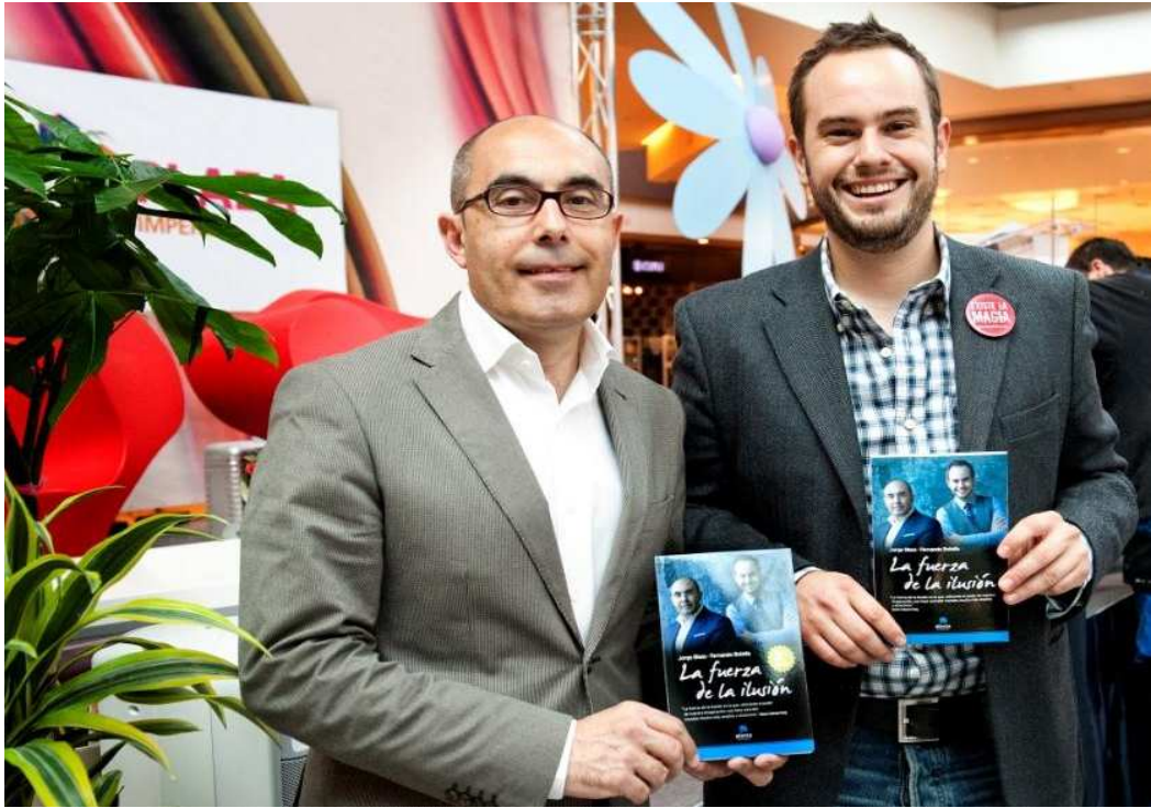
Presentaciones de libros